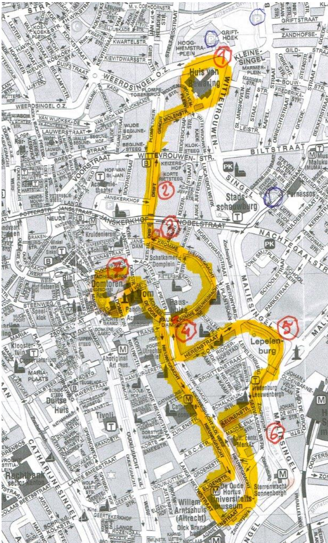
1 - Start bij Wolvenhoek