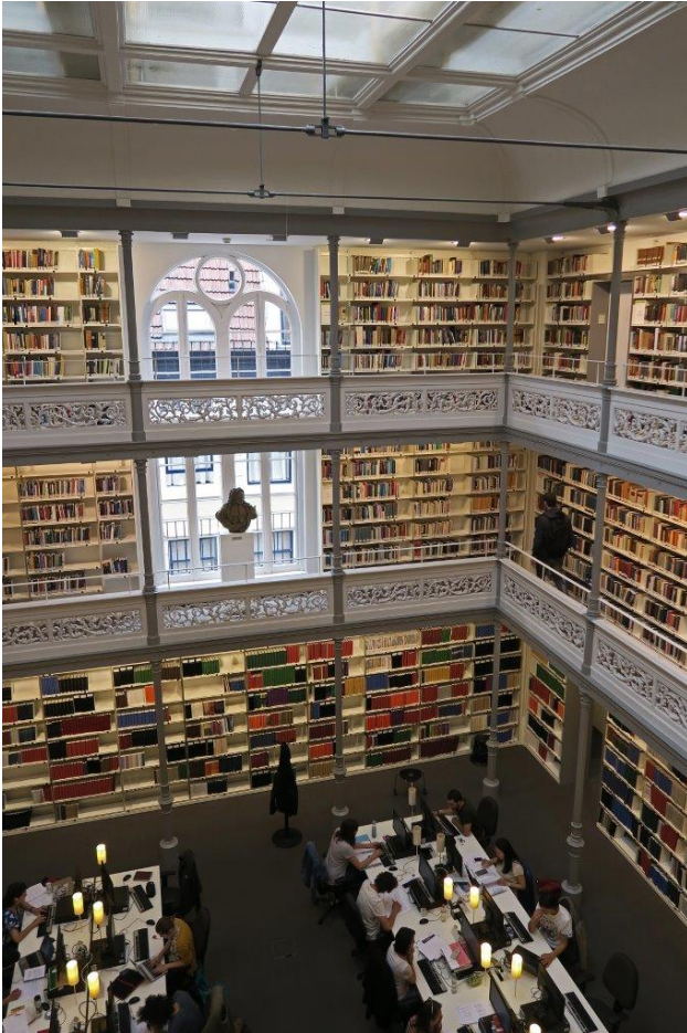
2 - Universiteitsbibliotheek

De rondleiding begint om 19:00 uur op het voorplein, bij het entreegebouw met het jaartal 1853. Tijdens de rondleiding gaan we trappen op en af, dat kan beperkingen opleveren als je moeilijk ter been bent. Op het Wolvenplein zijn voor bezoekers geen parkeerplaatsen beschikbaar. Wij raden jullie aan om gebruik te maken van de fiets of het openbaar vervoer. Een parkeeralternatief is parkeergarage Griffhoek, Wittevrouwensingel 96, 3514 AL Utrecht (bij Griffpark).