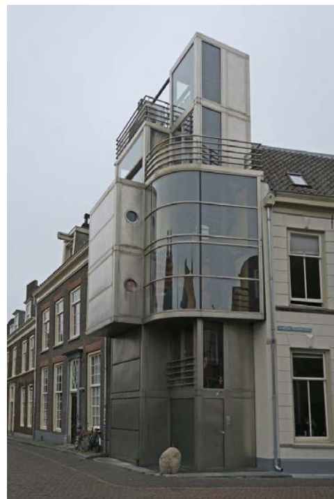
3 Drift - Kromme Nieuwegracht

Wij gaan weer terug naar de entree (let op de dikke taatsdeuren) en vervolgen onze weg Drift richting Janskerkhof (lichtobject?), steken de Nobelstraat over en lopen verder de Drift op, naar hoek Kromme Nieuwegracht (3). Hier zie je een stukje moderne invularchitectuur op een onmogelijk klein perceel met veel glas en metaal.