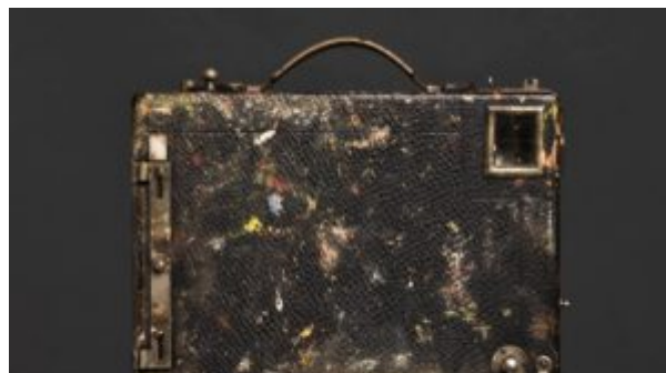
fototoestel Breitner, vol met verfspetters van de schilder/fotograaf

Tot en met 11 december kunnen jullie nog terecht in Museum Hilversum voor de ontroerende tentoonstelling 'PS Camera'. We zien hier fotowerk - en de daarbij gebruikte camera's - van oude