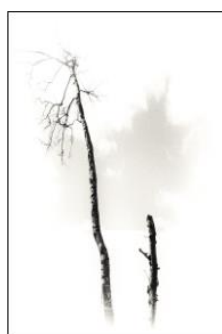
Nr 2. Foto 3