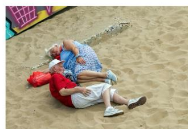
Nr 3. Foto 4 van Cees Snel

De waardering per foto en de totaalwaardering per persoon hieronder in de tabel.