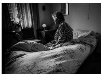
Nr 1. Foto 4 van Jan Donders