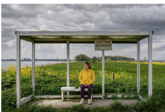
3 e