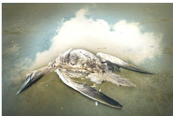
7 e Ton Verweij