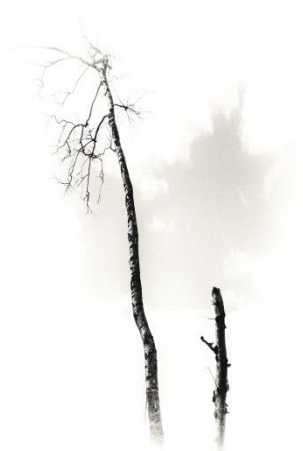
3 e ->