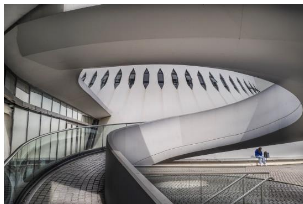
6 e Henk Post