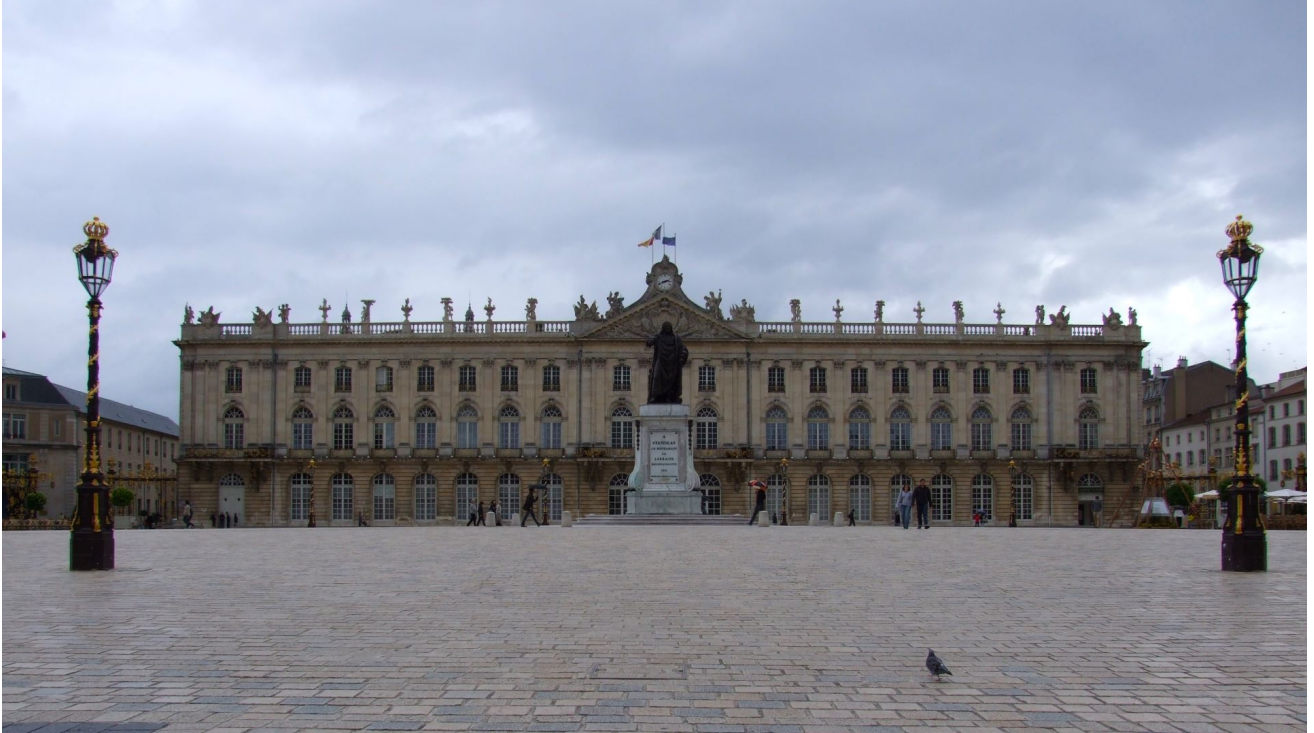
Uit mijn serie van het Place Stanislas in Nancy, volgens sommigen het mooiste plein van Europa. Kijk zelf maar waarom.

Hij is van plan lid te worden van de werkgroep architectuur en stelt zich voor met onderstaande mooie foto's: