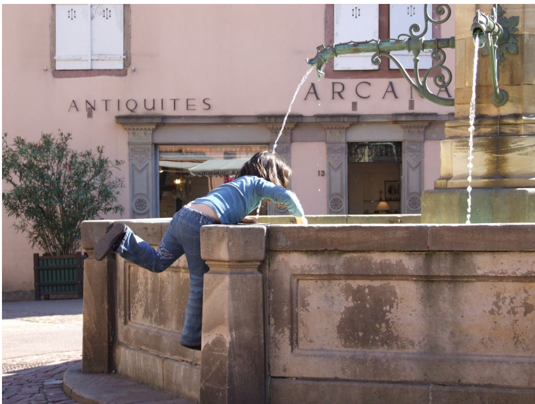
Balans in Colmar